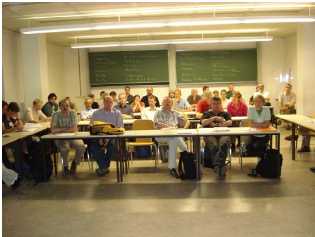
Treffen in Mainz im August 2009

Der Senat der Deutschen Forschungsgemeinschaft hat die Einrichtung des oben genannten Schwerpunktprogramms mit einer geplanten Laufzeit von sechs Jahren beschlossen. Ziel des voraussichtlich ab April 2010 geförderten Programms ist es, die algorithmischen und experimentellen Methoden in den angegebenen Gebieten substantiell voranzutreiben, sie – wo erforderlich – zu verknüpfen und sie – kombiniert mit theoretischen Ansätzen – an zentralen Fragestellungen aus Theorie und Praxis zu erproben. Des Weiteren soll die Weiterentwicklung und Vernetzung von in Deutschland (mit-)entwickelten freien Computeralgebrasystemen projektbezogen auf verschiedenen Ebenen unterstützt werden. Alle erstellten Programmpakete und Datenbanken sollen öffentlich und frei zur Verfügung gestellt werden.